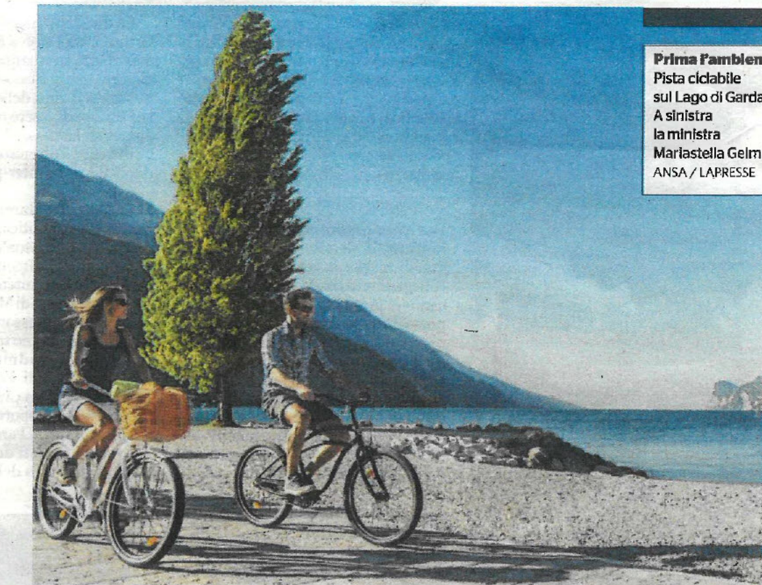
Prima l'ambiente Pista ciclabile sul Lago di Garda. A sinistra la ministra Mariastella Gelmini.

COSÌ LA PRESIDENTE della Comunità del Garda (che è Maria Stella Gelmini) nel 2017 ottiene un finanziamento di circa 130 milioni di euro (che ad oggi è lievitato fino a 230 milioni) per cambiare tutto il sistema, e nel 2018 si presenta il progetto di due nuovi depuratori (a Gardone e Montichiari), che porterebbe le acque reflue dal bacino del Garda in quello del lago d'Idro, scaricandole poi nel disastroso fiume Chiese. La reazione dei 15 comuni interes-