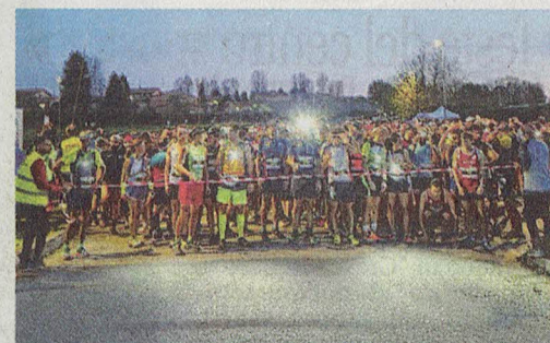
La spettacolare partenza del «Trail del ciliegio secolare»

Briosco, «Trail del ciliegio secolare»: anche quest'anno è stato un successo